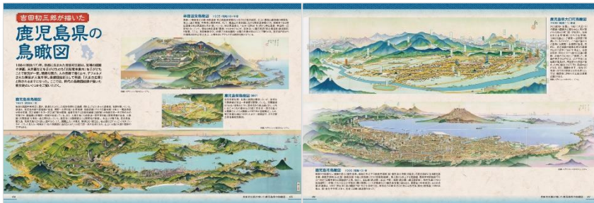
<「鹿児島県の鳥瞰図」代表誌面>