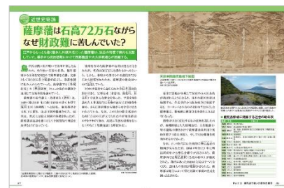
＜「鹿児島のトリセツ」歴史編ページ例＞

◆考古学上の定説「東高西低」を覆すものとなった、霧島市にある上野原遺跡。発見当時には、「国内最古級で、最大規模の定住集落跡」とされました。上野原台地に住んでいた古代鹿児島人は、どのような暮らしを送ったのでしょうか？ ◆江戸からもっとも遠く離れた外様大名だった薩摩藩は、外城制度や門割制度といった独自の制度で領内を支配していました。琉球を含めた薩摩藩の石高は 72 万石とされましたが、実際のところ 50 万石にも満たさなかったといい、財政が常にひっ迫していました。