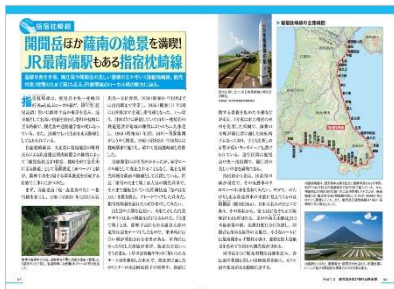
＜「鹿児島のトリセツ」鉄道網編ページ例 1＞

◆薩摩半島を半周、錦江湾や薩摩富士・開間岳の美しい景観の中をいく指宿枕崎線。浦島太郎の竜宮伝説をテーマにした特急「指宿のたまて箱」も走っている、その JR 最南端のローカル線の魅力に迫ります。 ◆大正期の南薩鉄道は、薩南中央鉄道に始まり、薩摩半島西側を縦走し、地域の脚として 70 年にわたって走り続けました。南薩線と万世線、知覧線、県内唯一の私鉄として活躍した「南鉄」の歴史を追います。