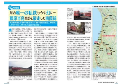
＜「鹿児島のトリセツ」鉄道網編ページ例 2＞