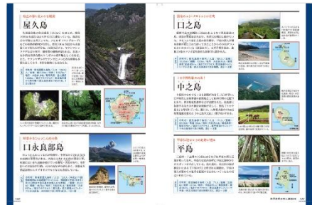
<「鹿児島県の有人離島 26」代表誌面>