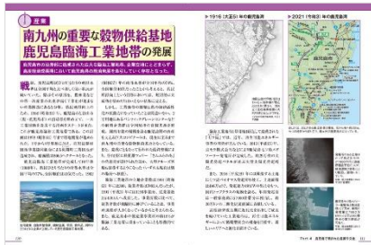
＜「鹿児島のトリセツ」産業文化編ページ例1＞