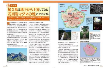
＜「鹿児島のトリセツ」地形編代表誌面 2＞

◆洋上アルプスと呼ばれる岩山や、巨大杉の森で知られる屋久島。海岸近くの亜熱帯の植生から、冬は降雪もある高山の植生までが、ひとつの島に存在していることも特徴です。このようなユニークな自然を育んだ屋久島は、成り立ちもとてもユニークなものです。