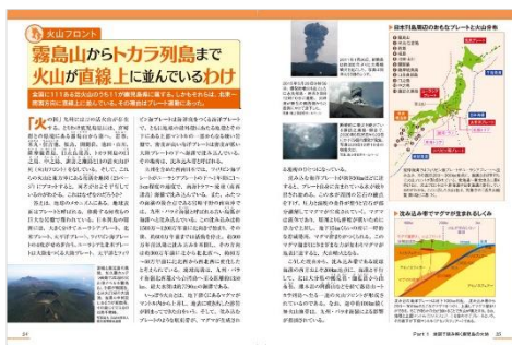
<「鹿児島県のトリセツ」地形編代表誌面1>

シリーズ共通の構成を用いて、「絶景グラビア」+「地図で読み解く鹿児島の大い」「鹿児島を駆け抜ける鉄道網」「鹿児島で動いた歴史の瞬間」「鹿児島で育まれた産業や文化」の4章立てとなる本書は、40以上の小テーマから、鹿児島県の素顔に迫ります。地元の方々が親しみやすいご当地ネタはもちろん、全国的に有名な鹿児島県の<あれこれ>も収録している、読み応え充分の一冊です。