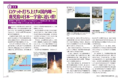
＜「鹿児島のトリセツ」産業文化編ページ例2＞