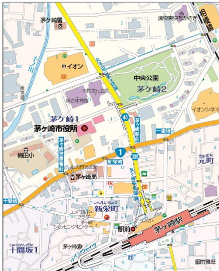
<「1万分の1」地図仕様見本>