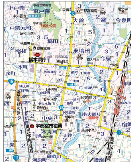
<「2万5千分の1」地図仕様見本>