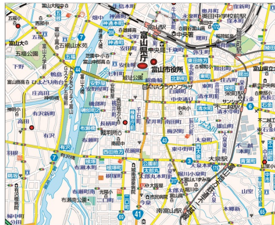
<「5万分の1」地図仕様見本>