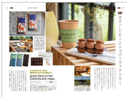
<ビントゥバーのページ例>

作り手が見えるビントゥバーの工房、ボンボンショコラのショコラトリー、憧れのヨーロッパブランドショコラなど、名店が一堂に会する東京。おいしさはもちろん、フルーツを飾った華やかなタブレットや、センスの良いパッケージなど、一押しポイントもそれぞれ。本当においしいショコラがひと目でわかるよう、本書はお店の特徴や雰囲気が伝わる写真をふんだんに盛り込みました。さらに目安となるチョコレートのサイズや、カフェサロンの有無など、訪問時の参考になる情報も掲載。ページをめくるだけでもテンションが上がりますし、プレゼント用のチョコレートをさがすときにも役立ちます。