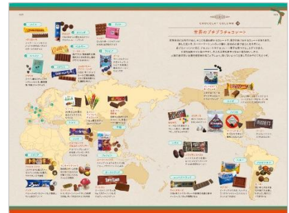
<「世界のプチプラチョコレート」>