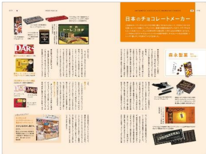
<「日本のチョコレートメーカー」>

スイーツ本シリーズで好評の「クロニクル」「全国コレクション」といった百科事典的なコンテンツは、今回のショコラ本にも登場。さらにショコラにまつわる11のコラムも読み応えあり。「日本のカカオの栽培」「昭和レトロなチョコレートスイーツ」「世界のプチプラチョコレート」などなど、写真付きの紹介で、甘くて深いショコラの世界へとご案内します。