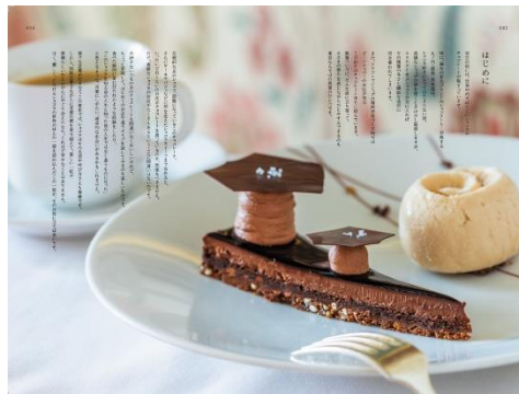
<「はじめに」ページ例>