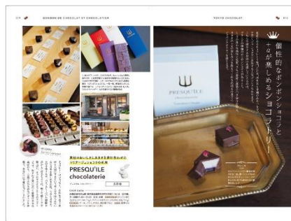
<ショコラトリーのページ例>