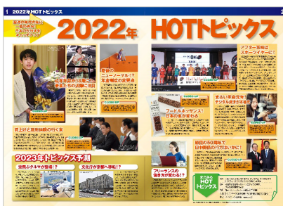
<2022年 HOT トピックス>

もう一つの特集「これからの副業トレンドに迫る」では、コロナ禍による在宅ワークの増加もあって推計570万人ともいわれる副業者について、現状とその背景、メリット、種類や始め方、将来像について解説しています。