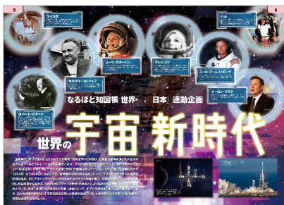
<宇宙新時代（世界編）>

日本編では宇宙における日本人の活躍と、日本の持つ技術力、これからの展望を特集しました。併せて読めば人類と宇宙の関わりを俯瞰し、世界と日本の立ち位置も把握できる、充実の連動企画です。