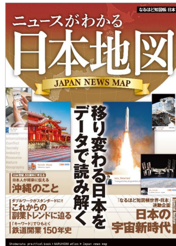
<なるほど知図帳 世界（左）、日本（右）の各表紙>