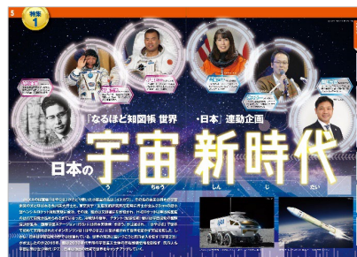
<宇宙新時代（日本編）>