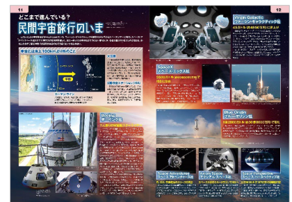
<民間宇宙旅行のいま（世界編）>

【リリースに関するお問合せ】 株式会社 昭文社ホールディングス 広報担当：竹内、張 TEL：03-3556-8124 | メールアドレス： koho-info.shobunsha@mapple.co.jp