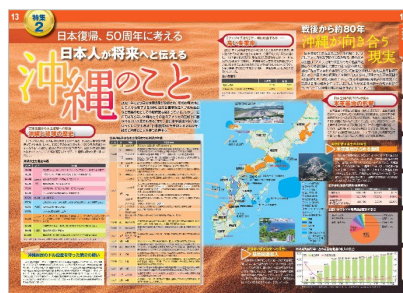
<本土復帰 50 周年に考える沖縄のこと>