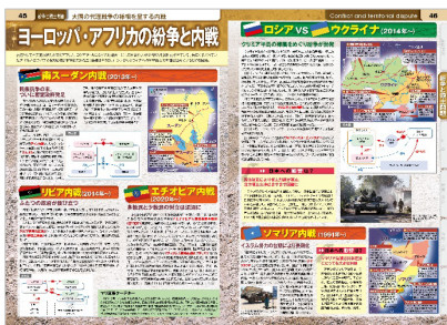
<ロシア VS ウクライナ>

『なるほど知図帳 世界』の特集はこのほか、戦後の世界秩序を大きく変え平和を揺るがす出来事であるウクライナ情勢を紐解くための地図解説ページ、ヨーロッパや中国をはじめとする自動車市場のEV化をめぐり、IT系企業までもが参入しての激しい次世代エコカー開発競争の特集ページ、いろいろなところで目にしながらもなかなか全貌を掴みにくいSDGs(持続可能な開発目標)のキホンの「キ」を押さえられる特集ページ、をそれぞれご用意。激動の2022年を見通すのに十分な内容です。