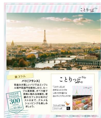
<パッケージの裏面に旅コラム付き>

パズルの仕上がりサイズ(26×38cm)はA3サイズに近いコンパクトさ。完成後フレームに入れて、お部屋を飾るインテリアに最適です。「ことりっぷ」のガイドブックを連想させるパッケージの裏面には、パズルのロケーションに合わせたことりっぷ編集部からの「旅コラム」付きで、旅好きの友人へのプレゼントとしてもおすすめです。