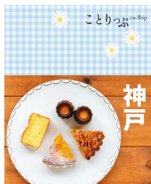
＜『ことりっぷ神戸』表紙＞

|| ことりっぷオンラインストア⇒ https://co-trip.stores.jp/