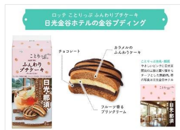
＜ことりっぷ ふんわりプチケーキ