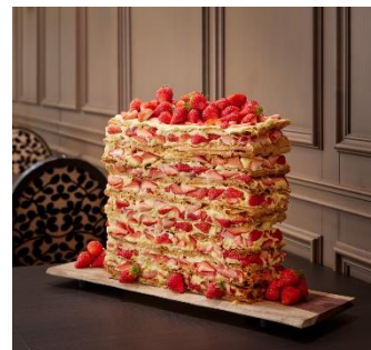
<神戸北野ホテルのミル・ミルフィーユ>

※神戸北野ホテルのミル・ミルフィーユは 12 月～5 月末までの提供です。同じ味のミルフィーユをミニサイズで 6 月以降もナイトデザートで楽しめます。