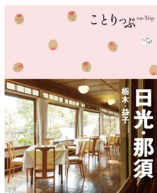
＜『ことりっぷ日光・那須』表紙＞