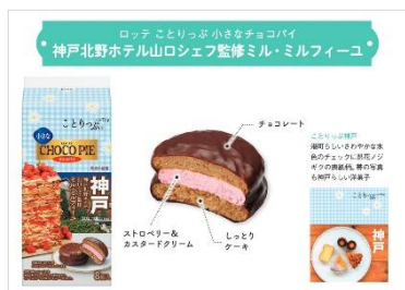
＜ことりっぷ 小さなチョコパイ

神戸北野ホテルのスイーツbuffetで提供される「ミル・ミルフィーユ」の味わいを表現した＜神戸北野ホテル 山口シェフ監修ミル・ミルフィーユ＞と、日光金谷ホテルのメインダイニングルームで提供される「金谷プディング」の味わいを表現した＜日光金谷ホテルの金谷プディング＞をお届けします。商品パッケージにはガイドブック『ことりっぷ』の「神戸」と「日光・那須」の表紙柄を採用しました。