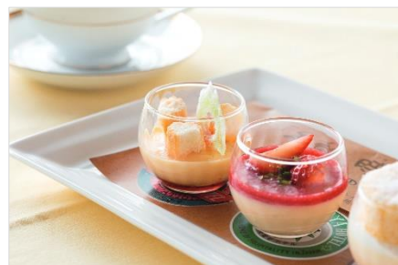
＜日光金谷ホテルの金谷プディング＞

メインダイニングルームで提供されている金谷プディングは、料理人達に代々受け継がれた、明治・昭和・平成 3 つの時代のレシピを再現したセットメニュー。その中で最も歴史の古い、明治時代の味のプリンを、今回のコラボメニューとして選びました。