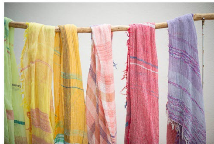
<左:「七窯社」、右:「tamaki niime」の商品(イメージ)>