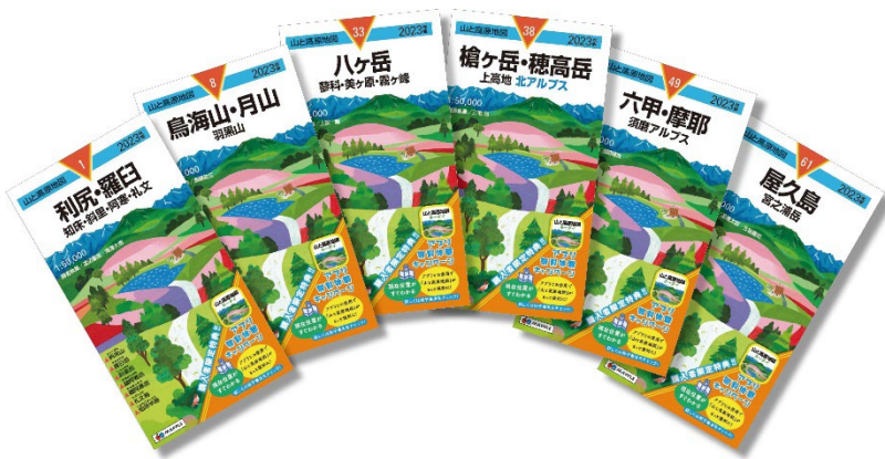
<2023年版の表紙イメージ>

2021年版から実施してご好評をいただいている 購入者限定のアプリ無料体験（トライアル）キャンペーン を2023年版でも実施。ご購入の『山と高原地図』2023年版の出版物と同じエリアの「山と高原地図ホーダイ」アプリが、6カ月間無料でご利用いただける購入特典が付きます。一覧性に優れる紙地図と、現在地がすぐにわかる電子地図を併用することで、より安全で快適な登山が可能となります。