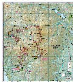
<新規収録図例(高隈山)制作途中につき内容は変更の可能性があります>