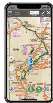
<「山と高原地図ホーダイ」使用イメージ>

【リリースに関するお問合せ】 株式会社 昭文社ホールディングス 広報担当 : 竹内