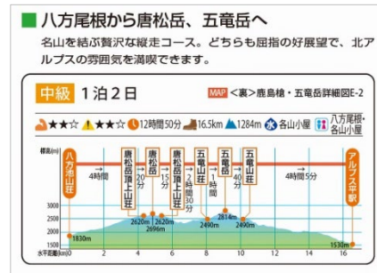
<コースガイド内容例>