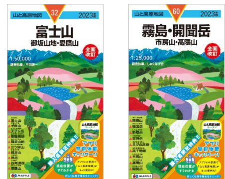
<全面改訂2商品 左：『32 富士山』 右：『60 霧島・開聞岳』>

また『51 高野山・熊野古道』においては伊勢神宮と熊野三山を結ぶ信仰の路、熊野古道「伊勢路」を新規に収録しました。