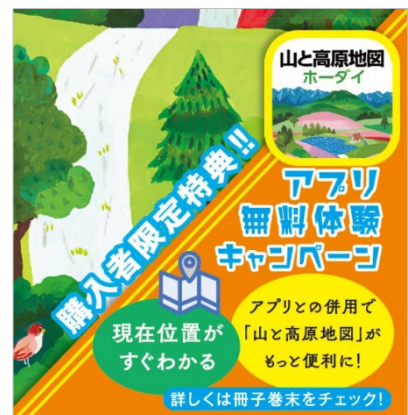
<アプリ無料体験キャンペーンのお知らせ部分拡大画像>