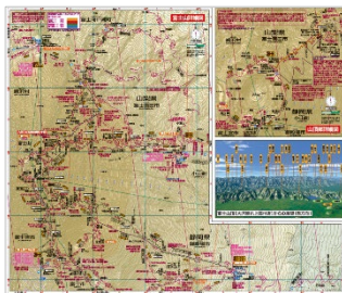
<収録図例(富士山詳細図)制作途中につき内容は変更の可能性があります>