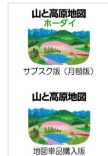
<上 : 「山と高原地図ホーダイ」 下 : 「山と高原地図」>