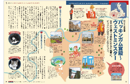
<「バッキンガム宮殿〜ウェストミンスター」>