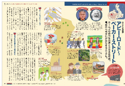
<「アビー・ロード〜ベーカー・ストリート」>