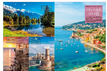
<「フランス南東・コルス島」>