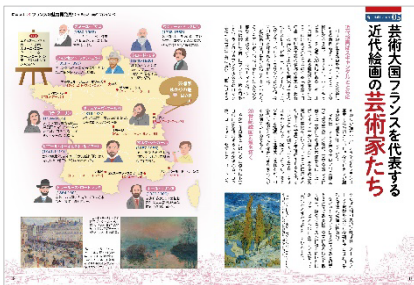
<「芸術大国フランスを代表する近代絵画の芸術家たち」>