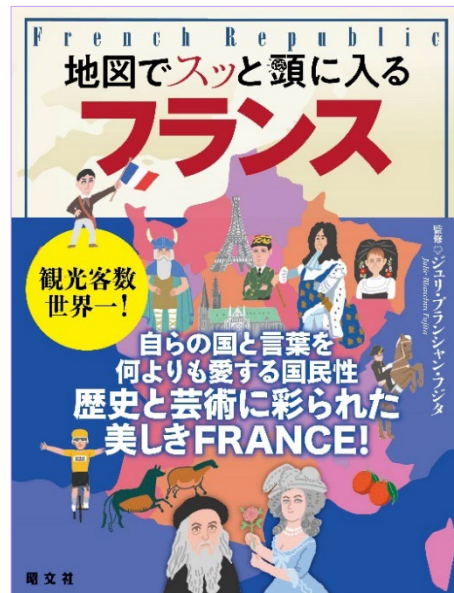
<左：『イギリス』、右：『フランス』の各表紙>