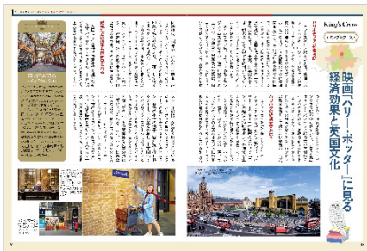
<「映画『ハリー・ポッター』に見る経済効果と英国文化」>