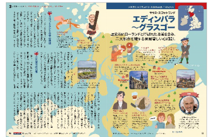
<「エディンバラ〜グラスゴー」>