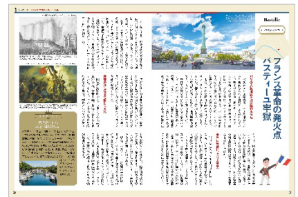
<「フランス革命の発火点 バスティーユ牢獄」>