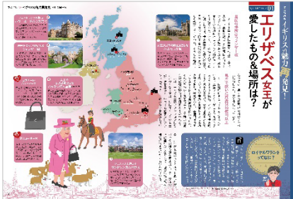
<「エリザベス女王が愛したものと場所は？」>