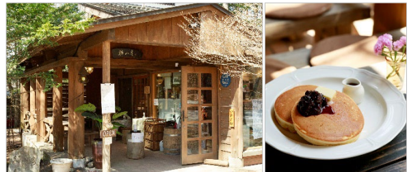
<左: お店外観、 右: 「昔懐かしい味のホットケーキ」>

軽井沢の静かな森の中に佇むカフェ『離山房』。かつてジョン・レノンとオノ・ヨーコ夫妻も足しげく通っていました。カフェスペースは木のぬくもりが十分に感じられ、遠方から訪れる人も多い人気店です。昔懐かしい味のホットケーキは、バターと特製のミックスベリーソースが添えられた、ほっと一息落ち着けるお店の人気メニューです。