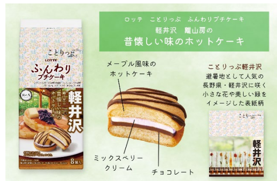
<「ふんわりプチケーキ」解説>

商品パッケージにはガイドブック『ことりっぷ』の「軽井沢」の表紙柄を採用。避暑地として名高い軽井沢に咲く小さな花や、美しい緑をイメージしたパッケージで、湿気が多い梅雨時や暑い夏の日でも、おうちにいながらにして、軽井沢の涼風や静かで美しい森の風情が感じられる、そんな商品に仕上げました。