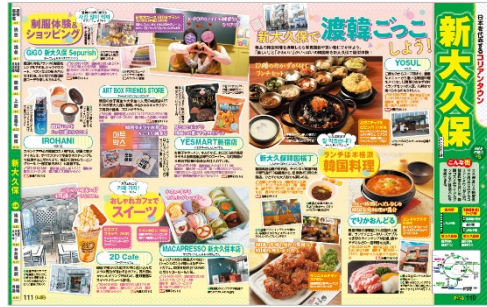
<この情報量をそのまま再現！>