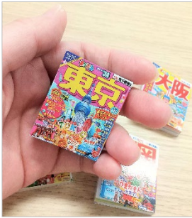
<手にすっぽり入る大きさ>