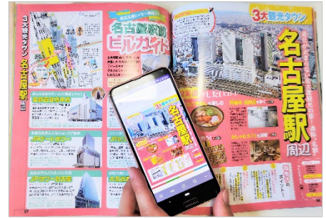
<「まっぐるリンク」で電書が読める！>