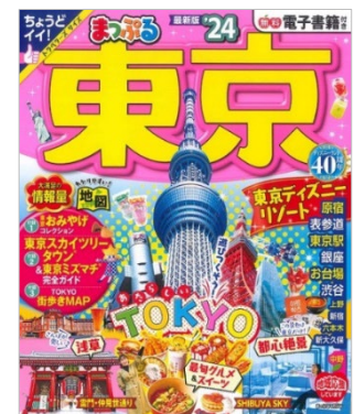
<「まっぐる 東京'24」表紙>

2022年9月からは軽くて、持ち歩きにもちょうどいいトラベラーズサイズ（縦223ミリ×横182ミリ）に変更、進化し続けるガイドブックシリーズです。