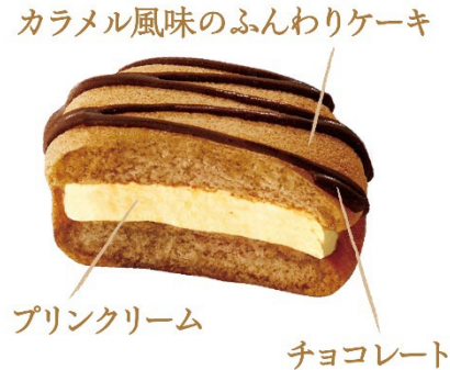
<「ふんわりプチケーキ」解説>