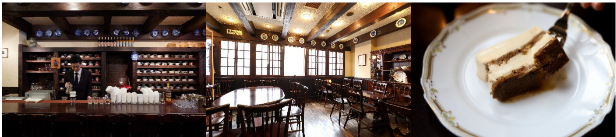
<左・中央：お店内装、右：「チーズケーキ」>

創業以来定番となっている一番人気のチーズケーキは、マスカルポーネを主とし、珈琲付けしたパウンドケーキと層になった口当たりなめらかなチーズケーキです。苦味、甘味、チーズ、リキュールが奏でる四重奏を楽しめます。