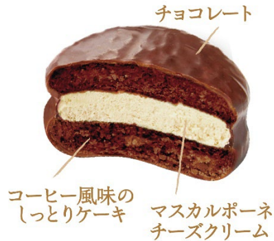
<「小さなチョコパイ」解説>