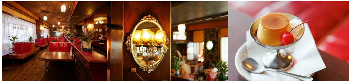
<左・中央：お店内装、右：「プリン」>

人気メニューは見た目もレトロで可愛い、昔ながらのプリンです。卵の味わいがしっかりと感じられる固めのプリンで、カラメルソースが卵の甘みを引き立てます。