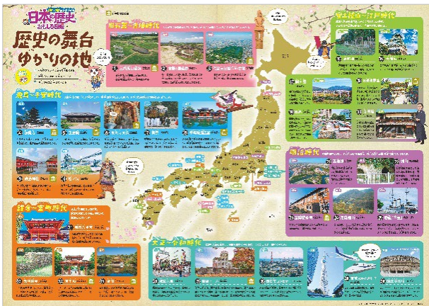
<付録 表「歴史の舞台 ゆかりの地」>