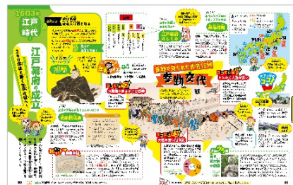
<重要な絵図の解説「参勤交代」ページ例>