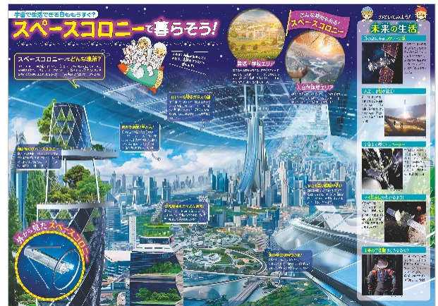
<付録 裏「スペースコロニーで暮らそう！」>