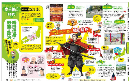
<偉人のクローズアップページ例>