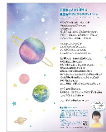
<黒田有彩さんからのメッセージ>