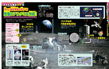
<まっぷる宇宙ラボ アルテミス計画>