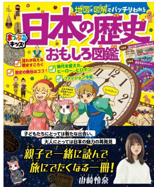
<左：『宇宙旅行』、右：『日本の歴史』の各表紙>