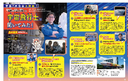
<金井宣茂宇宙飛行士インタビュー>