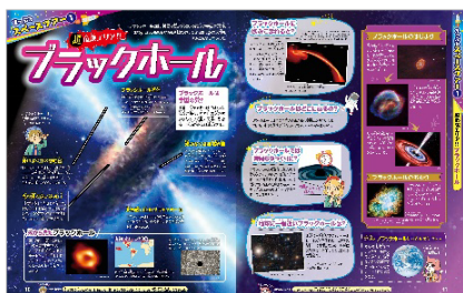
<宇宙旅行ページ例>