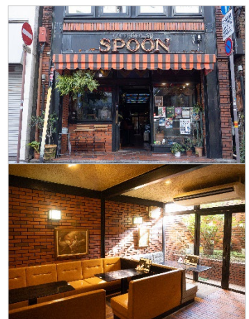
<上：店舗外観 下：店舗内観>

レモン果汁の代わりに店主のお父様が物部の豊かな自然の中で育てたゆずを手作業で絞った自家製のゆず果汁を使用し、店内で焼き上げるシンプルなケーキです。