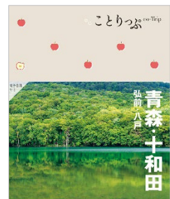
＜左：「高知」、右：「青森・十和田」のそれぞれ表紙＞