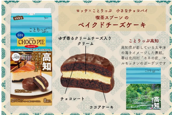
<「小さなチョコパイ」解説>