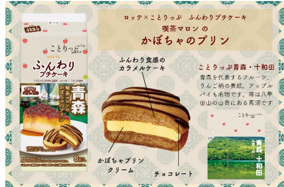
<「ふんわりプチケーキ」解説>