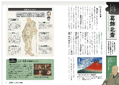
<人気絵師と浮世絵「葛飾北斎」>