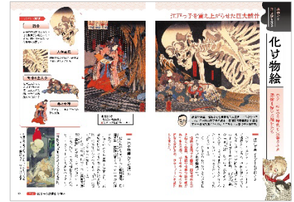
<名作から浮世絵を知る「化け物絵」>