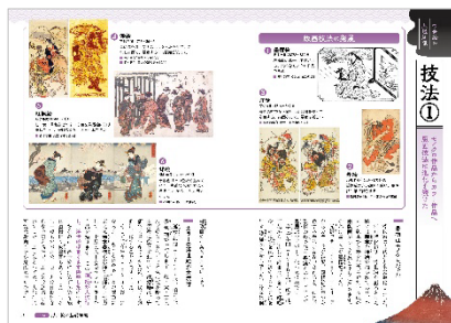
<浮世絵の基礎知識「技法①」>