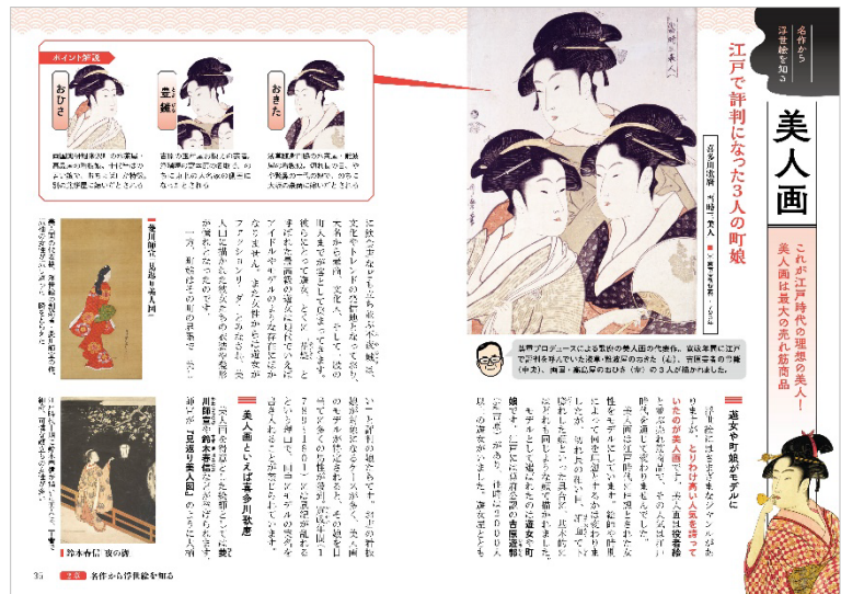
<左：表紙、右：代表誌面>