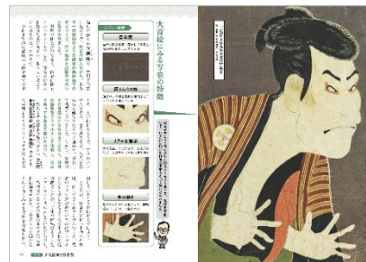
<人気絵師と浮世絵「東洲斎写楽」>