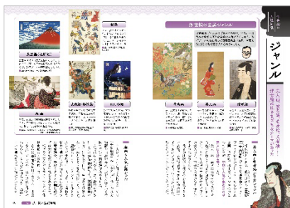
<浮世絵の基礎知識「ジャンル」>

江戸中期を舞台にした NHK 大河ドラマ「べらぼう」で注目をあびている浮世絵。海外でも「UKIYO E」として有名ですが、当の日本人はというと浮世絵の知識に乏しく、「よく知らない」のがホンネではないでしょうか？本書では浮世絵に興味はあるけれどもよく知らない、という方々を対象に浮世絵の基本から有名浮世絵師が描いた作品の鑑賞ポイント、製作工程に至るまで、図解しながらわかりやすく解説していきます。浮世絵を学ぶためのスタンダードとなることを目指した究極の「浮世絵ガイド」です。