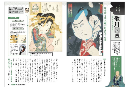
<人気絵師と浮世絵「歌川国貞」>