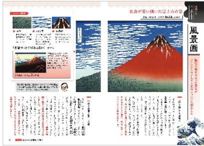
<名作から浮世絵を知る「風景画」>