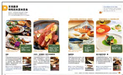
<「中国語繁体字版」ページ>