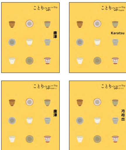
＜『ことりっぷ唐津』表紙 日本語版（左上）、英語版（右上）、 中国語繁体字版（左下）、韓国語版（右下）＞

『ことりっぷ』のインバウンド（翻訳）版については、日本人女性と同じ目線で旅をしたい訪日個人旅行者に対して有用のため、自治体や企業からのお問い合わせも多くいただいており、今後も各地域版を発行する方向です。