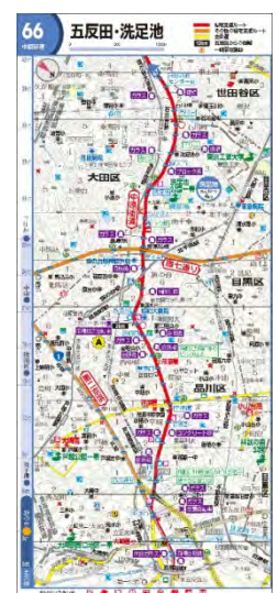
<『帰宅支援マップ 首都圏版』表紙> <帰宅支援ルート図例>