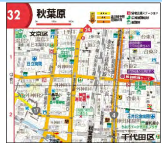
<「東京都心メッシュ図」(一部)>

本書では「帰宅支援ルート」の起点にたどりつくための、山手線内側全域をカバーした「東京都心メッシュ図」も掲載しています。地図上の主要道路には、地盤の弱さ・火災危険度・建物倒壊危険度といった情報を元に、震災時の 歩行困難度の予想状況 を3つのレベルで示しています。