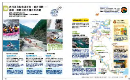
&lt;「アクティビティ」紹介ページ&gt;