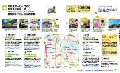
&lt;「散策プラン」ページ&gt;

中国語繁体字版については台湾・香港からの訪日観光客に向けた、日本語版とは異なる誌面構成です。限られた滞在時間で新宮周辺を楽しめるよう、市内の見どころ巡りにグルメやスイーツ、かき氷の味わえるスポットを組み合わせた散策プランを提案。熊野三山についての解説ページや、人気のアクティビティ紹介ページもあり、盛りだくさんの内容です。