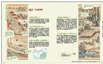
&lt;「熊野三山」解説ページ&gt;