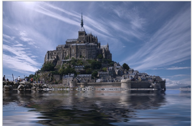
<左：九份、右：モン・サン・ミッシェルのそれぞれイメージ画像>

他にも、アジア・ヨーロッパの人気の観光スポットを楽しんでいただけるオプショナルツアーを多数ご用意しています。