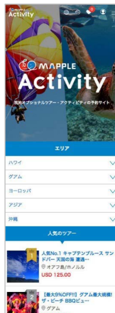
<MAPPLE アクティビティ新 TOP 画面>