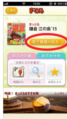
<ガイドブックメニュー から電子書籍へ>