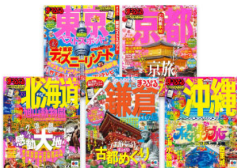
<対象の『まっぷる』国内エリア版(一部)>

旅先に携行することが前提の旅行ガイドブックでは「 本と電子書籍のダブル使い 」が使い方としてスタンダードになると見据えて、今後も読者限定のお得な宿予約やクーポン配信など、みなさまの旅をよりいっそう楽しくする提案を行ってまいります。