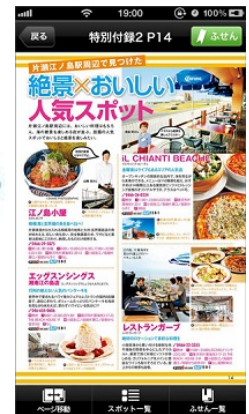
<誌面をご覧いた だけます>