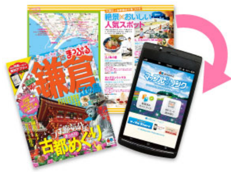
<マップルリンクの電子書籍機能(イメージ)>