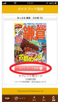
<対象のガイドブックを ダウンロード>