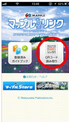
<マッフルリンク TOP 画面>