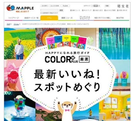
<コラム TOP 画面>

当社コーポレートサイトのコラムコーナーにて、「COLOR+ (カラープラス)」のシリーズコンセプトや内容、キャンペーン情報などを紹介するコラム「HAPPYになれる旅行ガイド COLOR+ (カラープラス) 厳選 最新いいね! スポットめぐり」を公開しております。 ⇒ http://www.mapple.co.jp/mapple/column02/items/colorplus.html