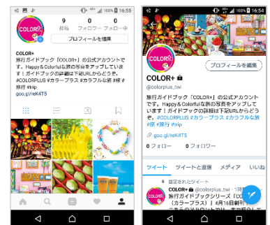
<左：公式 Instagram、 右：公式 Twitter の TOP 画面>