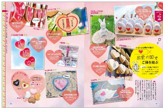
<「出雲大社 松江」代表誌面>