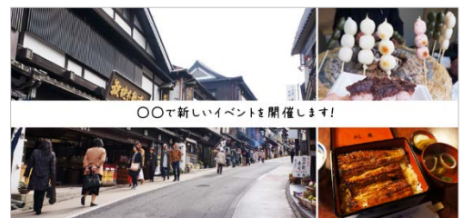
＜「観光客ターゲティング広告」イメージ＞

旅先で訪れた Beacon 等ジオフェンス機能のある施設、店舗に関連する施設や系列店舗の近くを別のエリアで通った際にその情報を配信する。