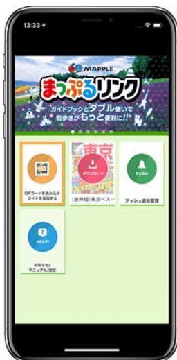
< 「まっぷるリンク」 TOP 画面 >