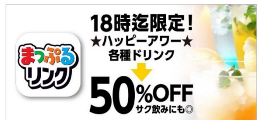
＜「電子チラシ配信広告」イメージ＞

17:00～19:00 の時間帯にビジネス街を通過するユーザーに、飲食店のクーポンや紹介記事を配信する。