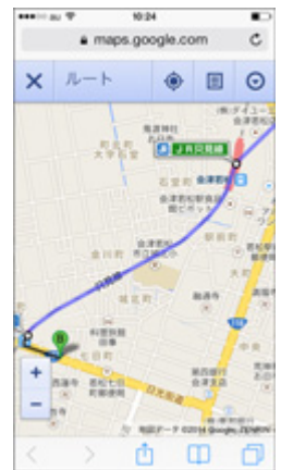
「ルート」をタッチすると、 現在地からのルートを表示