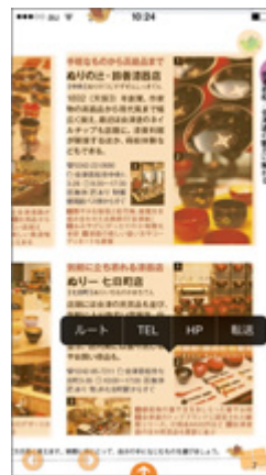
スポットに対する 機能ボタンがでます