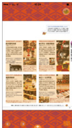
気になるスポットを タッチ