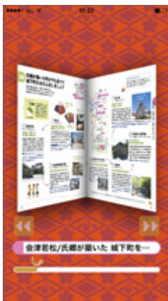
画面上でも本のよ うにパラパラめく れます

小冊子『ことりっぷ 会津 華たび』の電子書籍版を電子ブックアプリ『ことりっぷアプリ』の無料コンテンツとして、期間限定でご提供いたします。このアプリはただデバイス上で誌面を表示するだけではなく、記事をタップすると、様々な機能を使うことができます。「ルート」メニューを選択すると、外部地図アプリが起動し現在地から目的地までのルートを表示することができるので旅先で迷う心配がありません。旅行前のプランニングにも旅行先での街歩きにも大変役に立つアプリです。