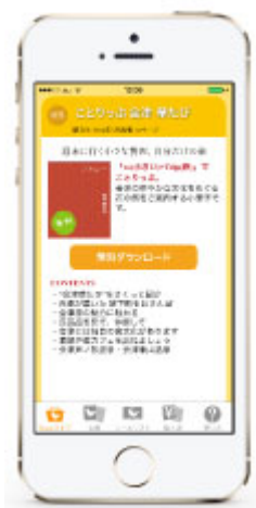
<ことりっぷアプリ>

『ことりっぷ 会津 華たび』は、この春行きたい会津若松の魅力をご紹介する、会津若松観光物産協会発行の観光ガイド小冊子です。