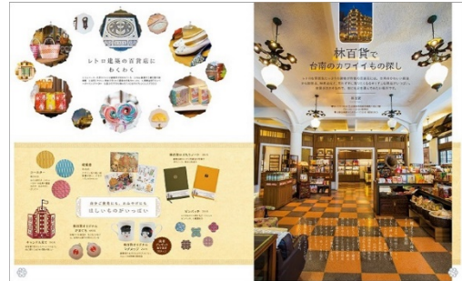
<「台南ノスタルジック旅」ページ例 2>