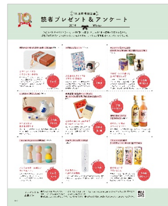
<「10 周年特別企画 読者プレゼント & アンケート」ページ>