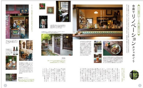
<「台南ノスタルジック旅」ページ例 1>

ほか [book in book] として台湾の古都「台南ノスタルジック旅」も特集。芯からリラックスでき自然と笑顔になれるような、五感に響く冬の旅をご提案する一冊です。