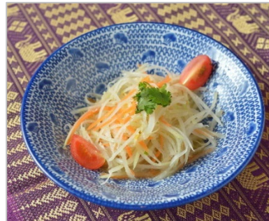
<メニュー例 「青パイアのサラダ」>