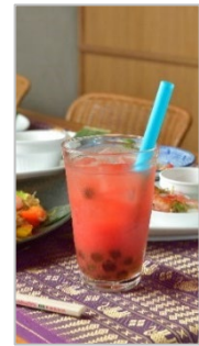
<メニュー例「タピオカ 生スイカジュース」>