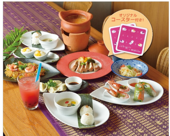
<「ディナーコース」イメージ>

ほか、予約をした方には特典として「ことりっぷ バンコク」の表紙柄を使ったオリジナルコースターをプレゼント。ドリンクメニューもタイの魅力味わえるシンハービール、ソルティライチサワー、生スイカジュースなど40種類以上の飲み物メニューから選べ、さらにデザートも2種から選択可能。大変魅力的なコース構成となっています。