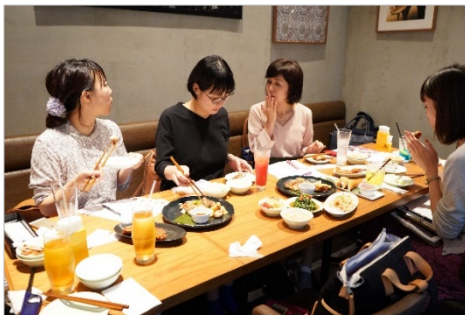
<編集部によるセレクトの様子>