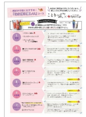
<「ことりっぷコラボコース」専用パンフレット>