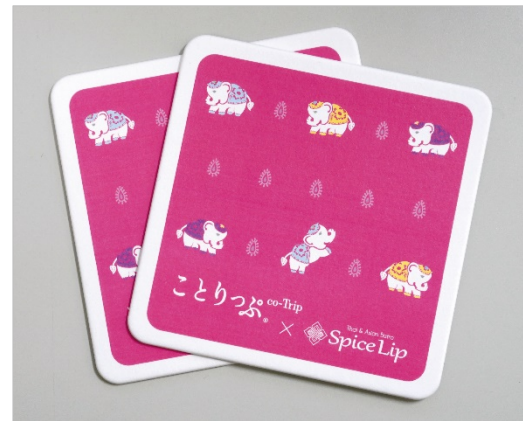
<オリジナルコースター>