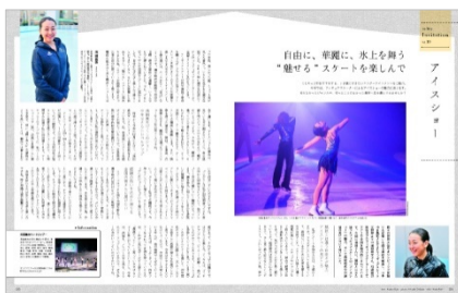
<「co-Trip Invitation アイスショー 浅田真央さん」>