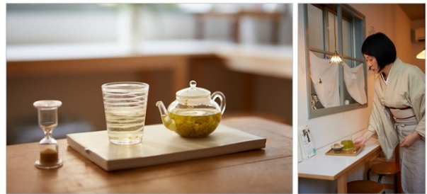
<「茜夜」ワークショップのイメージ画像>