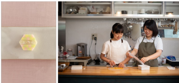
<「ユイミコ」ワークショップのイメージ画像>

ことりっぷ WEB の特設ページ ( https://co-trip.jp/article/336550/ ) よりお申し込みいただけます。