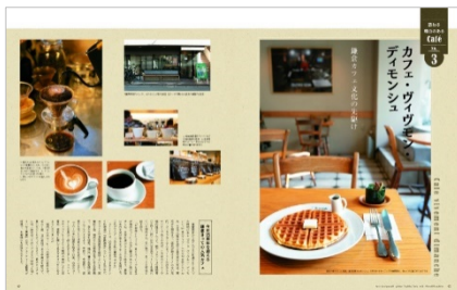
<「訪ねる理由のあるカフェ」ページ例>