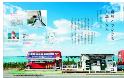
<「カフェのある町」ページ例>