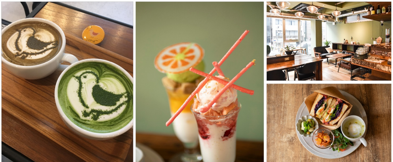
<「ことりっぷコラボカフェ」イメージ>

株式会社昭文社（本社：千代田区麹町、代表取締役社長 黒田茂夫、東証コード：9475）は、人気ガイドブックシリーズ「ことりっぷ」の創刊 10 周年を記念した「ことりっぷ 10 周年の 10 のこと」の企画のひとつとして、「コラボカフェ」を 3 月 12 日～17 日の 6 日間開催すること、および「ワークショップ」を 3 月 12 日、3 月 16 日に開催すること、をお知らせいたします。