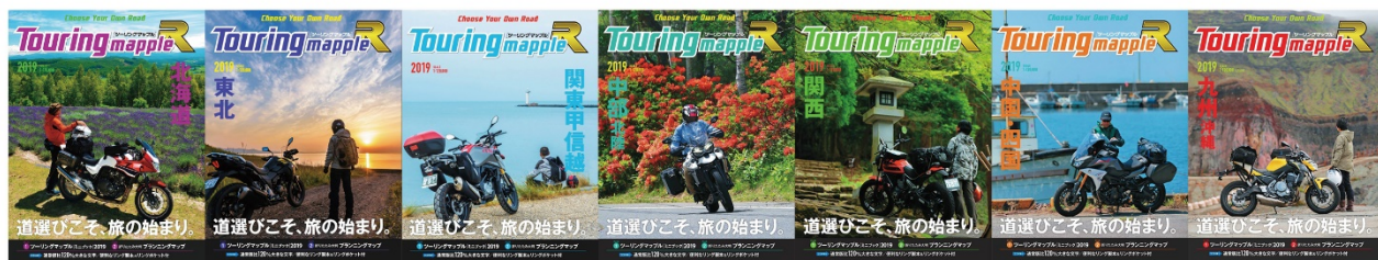
＜上段：「ツーリングマップル」 下段：「ツーリングマップル R」の各表紙＞