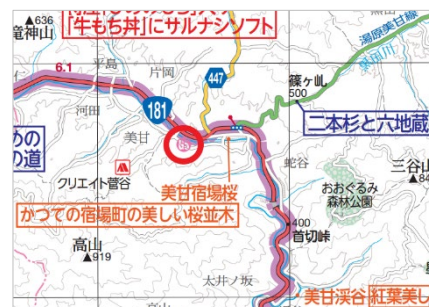
＜ガソリンスタンドの掲載例＞

特に、基本的な地図情報ですが利用価値の高い コンビニ・ガソリンスタンド の配置を全て見直しました。山間部などで「 あるとうれしい 」「 ないと困る 」ような施設は積極的に表示するよう努めています。