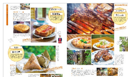
<「山グルメ」紹介ページ例>