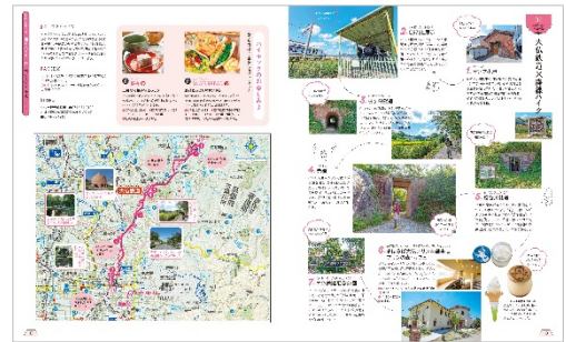
<「大仏鉄道」ページ例>