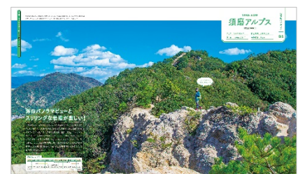
<「関西の定番山」紹介ページ例>