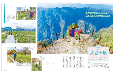
<「絶景山」紹介ページ例>

地図とガイドブックの出版で培った楽しくて見やすい誌面で、山ガール未満の女子から本格派まで、京阪神周辺のハイキングを目一杯 Enjoy できる一冊です。