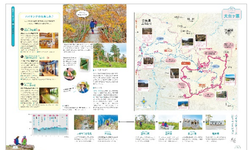
<「大台ヶ原」ページ例>