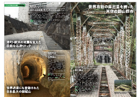
<産業遺産ページ例>

商品名 : きっと見に行きたくなる すごい産業遺産 体裁・頁数 : A4判 (H297×W210)、本体 96 頁 発売日 : 2019年7月8日 全国の主要書店で販売 定価 : 800 円+税 出版社 : 株式会社 昭文社