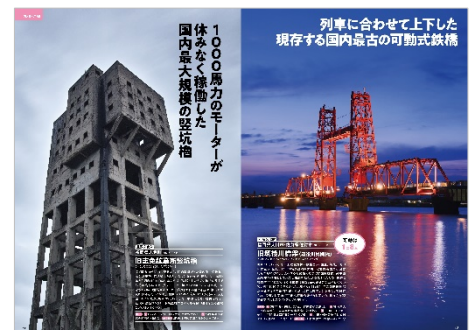
<九州・沖縄ページ例>