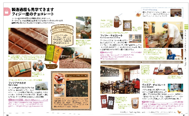
<フィジー産のチョコレート>