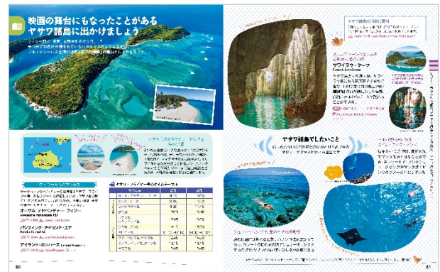
<映画の舞台にもなった、ヤサワ諸島に出かけましょう>