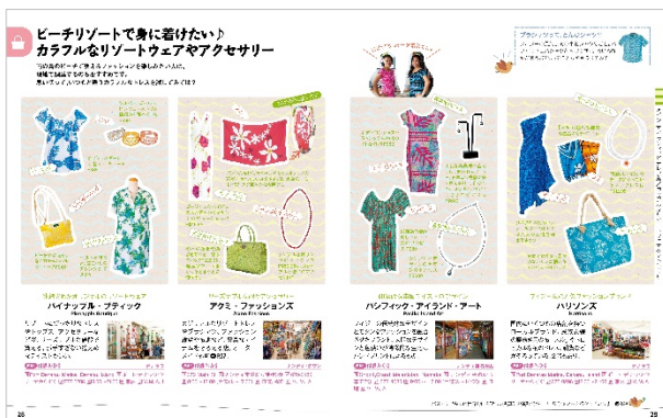
<カラフルなリゾートウェアやアクセサリ>