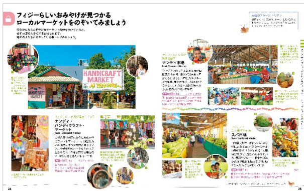
<ローカルマーケットをのぞいてみましょう>

フィジーの魅力ある小さな島々 バヌアレブ島の見どころ タベウニ島で過ごす休日 ほか