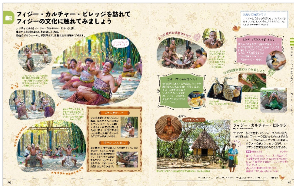
<フィジーの文化に触れてみましょう>