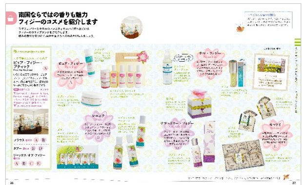
<フィジーのコスメを紹介します>