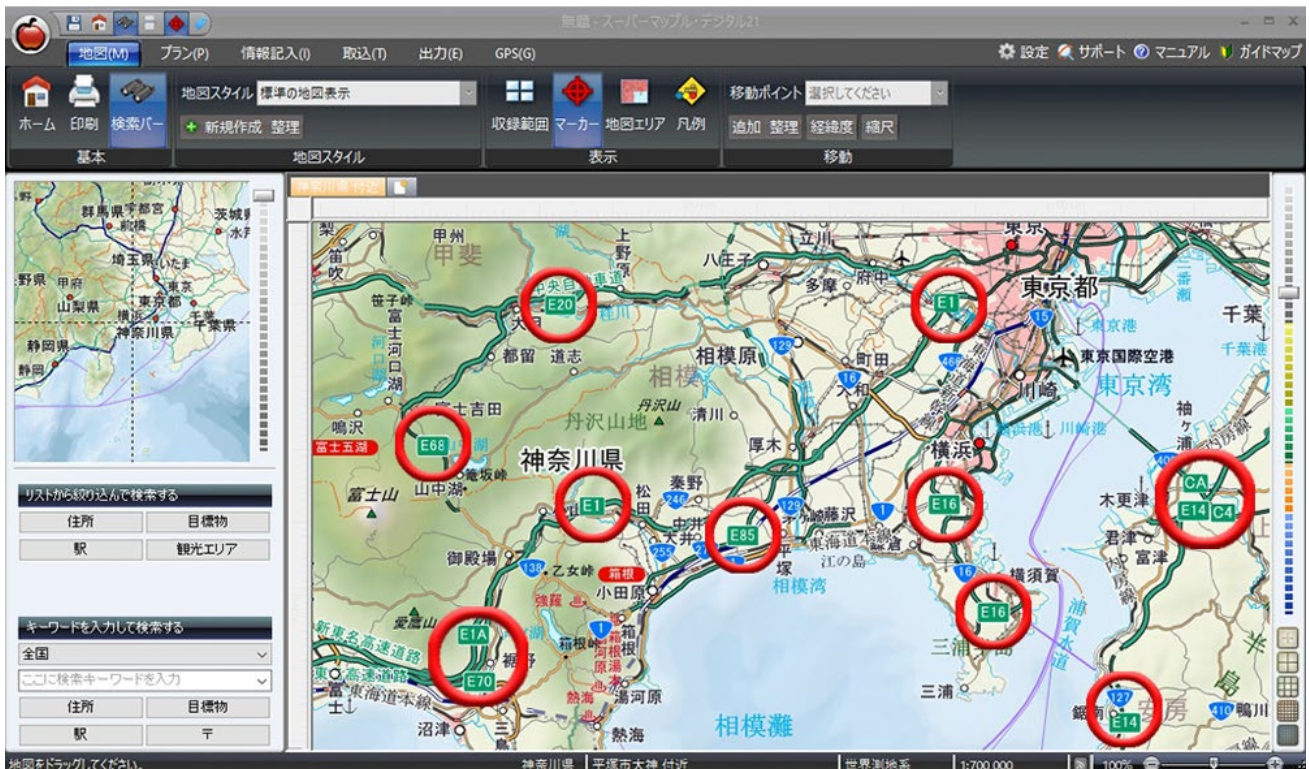
<高速道路ナンバリングアイコンの表示例 (赤丸内) >

昨今普及、認知が広がってきている高速道路ナンバリング(路線番号)アイコンを地図上に表示するようにしました。シンプルかつコンパクトなデザインで高速道路路線をかたんに識別できます。