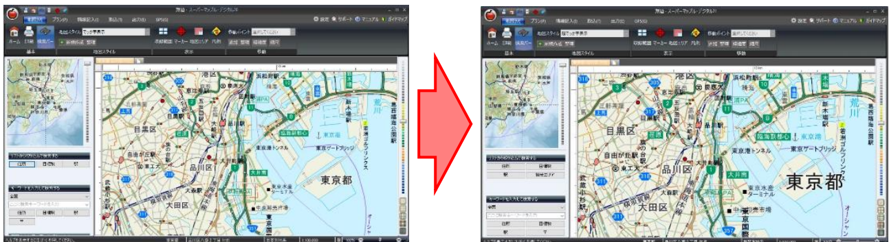
<従来からの「でっか字」スタイル (左) と今回追加の「超でっか字」スタイル (右) の表示例>

※4 地図の色味や文字の大きさなどをプリセットした定義データ。標準のほか、グレー表示、ミッドナイト表示、白地図表示、等高線強調表示、高速道路強調表示など、16種類のスタイルが用意され、用途に応じてお選びいただけます。さらに自分だけのオリジナルスタイルを作ることでもできます。