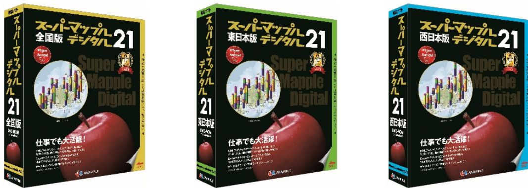
<左：全国版 中：東日本版 右：西日本版の各パッケージ>