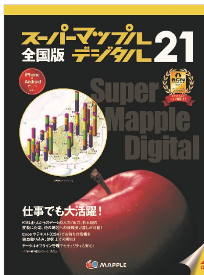
<パッケージ例(正面)>