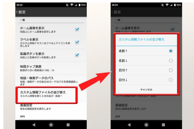
<カスタム情報ファイルの並び替え機能画面>

設定メニューの追加により、カスタム情報の並び順をファイルの名前と作成日時それぞれの昇順、降順の4種類の中から選択できるようになりました。