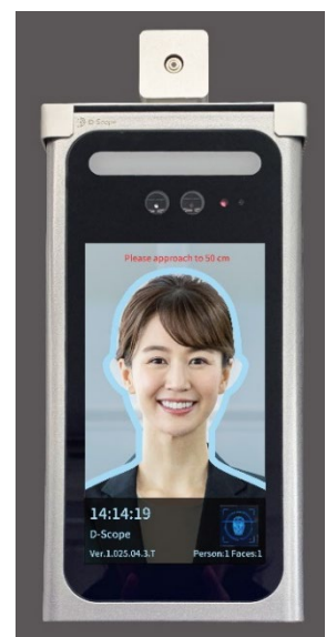
＜左：DS Face FC、右：設置イメージ＞