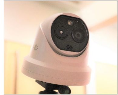
＜サーモカメラによる体温検出の例 左：多人数検出イメージ、右：体温表示画面＞