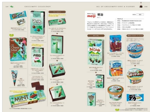
<歴代チョコミントコレクション>

懐かしい商品から、有名商品のミントフレーバーバージョンまで、<チョコミン党>の心をわしづかみにする、まるで楽しい図鑑のような充実ぶりです。