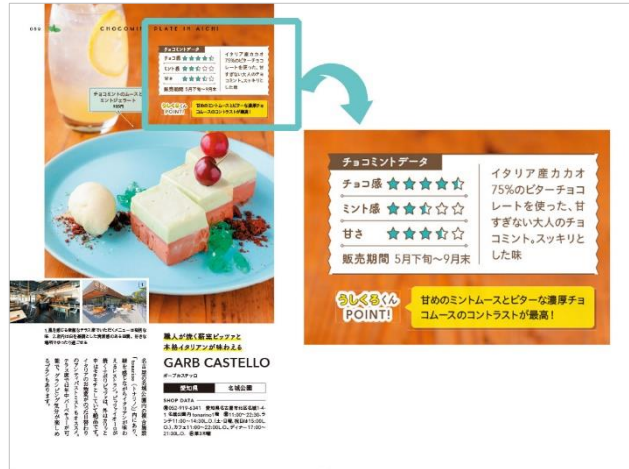
<カフェで楽しむチョコミント>

チョコ感・ミント感・甘さ・販売期間の指標入りで、さらにテイクアウト有無の情報も記載されており、ガイドとしての使いやすさも追求しています。