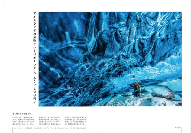
<自然遺産「ヴァトナヨークトル氷河/アイスランド」>

<観る教養>を目指した本書の誌面は、絶景の傍らで綴る、 素朴な疑問とシンプルなお返 も注目ポイントとなります。「もしかして、ここは火星？」(ナミブ砂漠/ナミビア)、「なぜ、フラミンゴの体はピンクなの？」(ボゴリア湖/ケニア)等、ページをめくりながら、世界遺産にまつわる教養をサクッと身につける工夫も、随所に盛り込みました。