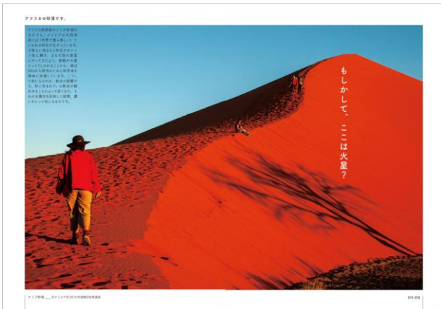
<「もしかして、ここは火星？」ページ例>

<観る教養>を目指した本書の誌面は、絶景の傍らで綴る、 素朴な疑問とシンプルなお返 も注目ポイントとなります。「もしかして、ここは火星？」(ナミブ砂漠/ナミビア)、「なぜ、フラミンゴの体はピンクなの？」(ボゴリア湖/ケニア)等、ページをめくりながら、世界遺産にまつわる教養をサクッと身につける工夫も、随所に盛り込みました。