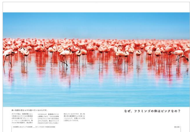
<「なぜ、フラミンゴの体はピンクなの？」ページ例>

さらに本書のコラムでは、世界遺産のように見えて実はそうでない絶景スポットも12件取り上げています。