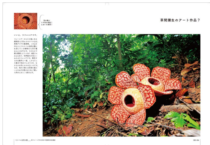
<自然遺産「キナバル山/マレーシア」>

「海の世界遺産」「大地の世界遺産」「山の世界遺産」「神秘の世界遺産」、それぞれ選りすぐりの絶景写真は、想像力を掻き立てられる要素に溢れています。自然の魅力を再認識するきっかけとなる一冊です。