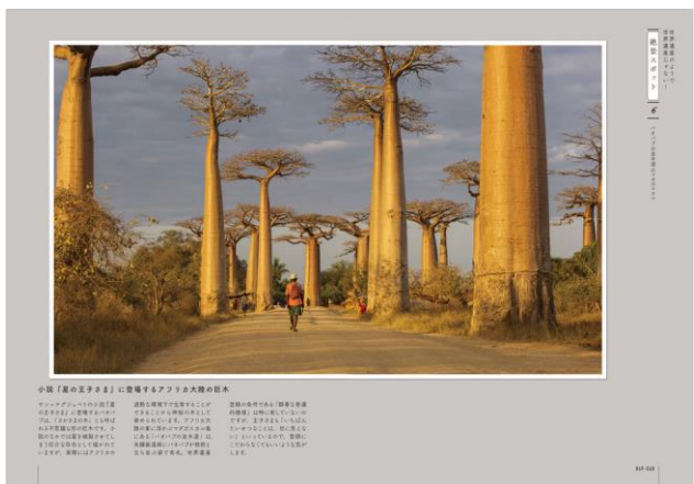
<コラム「バオバブの並木道」ページ例>

さまざまな理由を知ること、<世界遺産とは何か?>を考え、<人と自然>への理解をより深めることができる、そんな本に仕上げました。