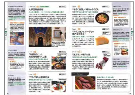
<物件紹介ページ (四国)>

●電子書籍が全ページ見られたり宿泊予約が5%OFFになったりと、便利でお得な無料付録アプリ『マップルリンク』も更にバージョンアップ。編集者が集めながら本には掲載しきれなかったディープな現地ネタ「編集部旅コメント」(「旅コメ」)を掲載。今後も続々とサービス・コンテンツを拡充させていく予定です。