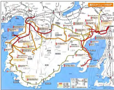
<運行スケジュール MAP (南紀伊勢)>

●本文では主要エリア間のアクセスと所要時間と料金が一目でわかる「アクセス早見表」や、最新の時刻表を調べるのに便利な二次元バーコードを掲載しました。また街歩きに使う地図には駅など主要地点からの距離を図示し、ユーザビリティにこだわっています。