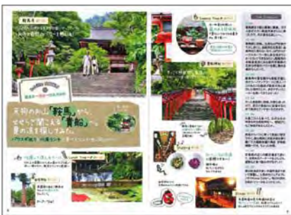
<巻頭グラビアページ (京都)>

●もちろん通常のガイドブックとしての機能も充実。現地の見どころをビジュアルに見渡せるグラビアページ、編集者イチオシのクローズアップ (特集) ページ、カセット式でスポットが見やすく探しやすい物件紹介ページなど、シンプルながらも便利さを追求したデザインとなっています。