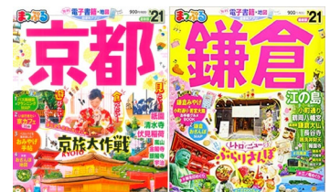
<昭文社の発行する観光ガイドブック>