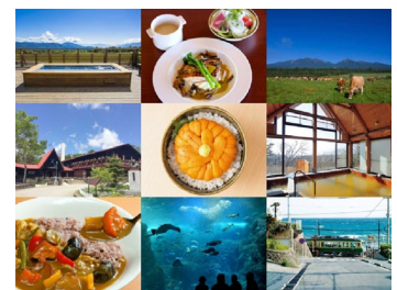
<季節別の人気スポットイメージ>

このツールを活用いただくことで、旅行者が「 どこを訪れようとしているのか？ 」「 どのくらいの範囲で行動しようとしているのか？ 」といった観光地における行動意向を様々な角度から客観的に分析・把握することが可能になります。