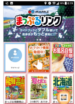
<まっぷるリンクアプリ>

観光分析に必要な様々な機能を搭載しております。特に地図を活用した情報表示は地図会社ならではの分析メニューとなっております。