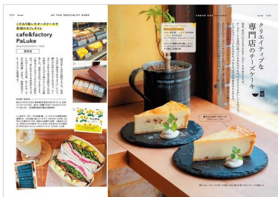
<「専門店のチーズケーキ」ページ例>