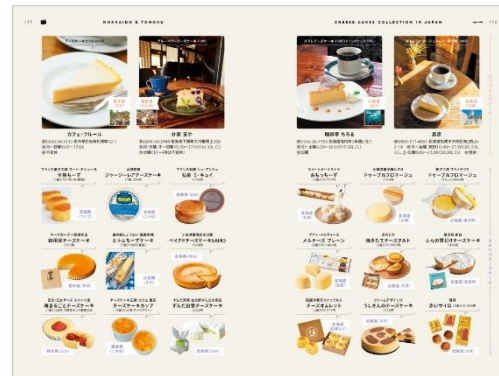
〈「全国チーズケーキコレクション」ページ例〉