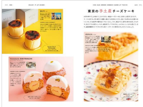
〈「東京の手土産チーズケーキ」ページ例〉

お店のチーズケーキだけではなく、手土産にも喜ばれ、自分へのご褒美としても良い「東京の手土産チーズケーキ」、「全国のお取り寄せチーズケーキ」、さらにコンビニやまちかどケーキ店でも入手できる「身近なチーズケーキ食べ比べ」、巻末には日本全国46都府県を網羅した「全国チーズケーキコレクション」も充実。〈チーズケーキ好き〉の方にも納得いただける内容です。