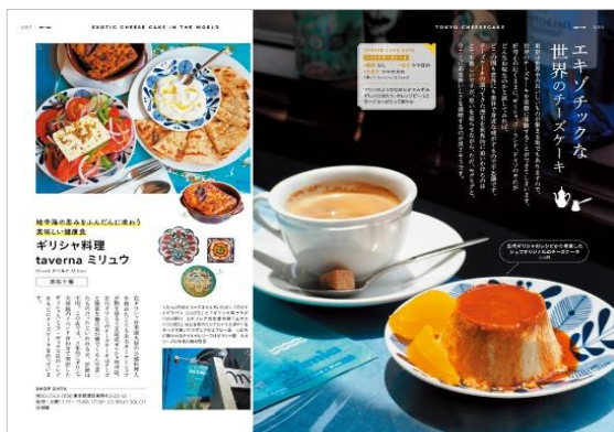
<「世界のチーズケーキ」ページ例>