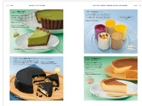
〈「全国のお取り寄せチーズケーキ」ページ例〉