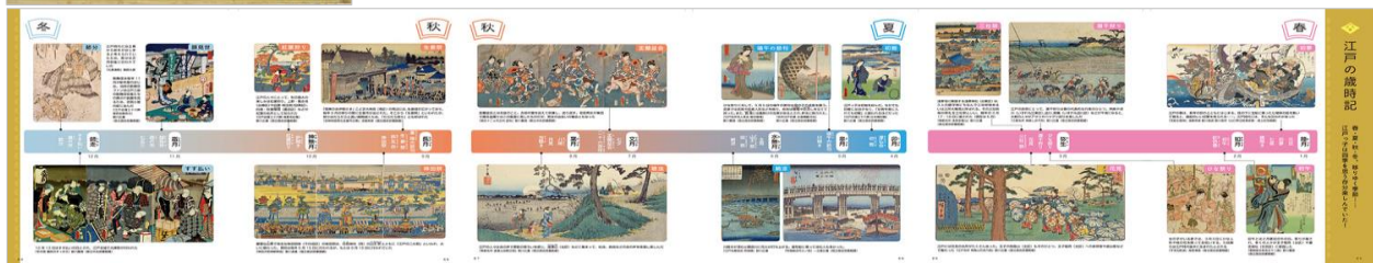
<表紙（左上）と「江戸の歳時記」ページ例>

密かに知名度を高めている「スツと頭に入る」シリーズの最新刊は、世界史上でも稀な250年以上平和な時代が続いた「江戸時代」に焦点を当て、 オール図解で江戸の全貌がすばやくつかめる実用的な江戸案内本 です。