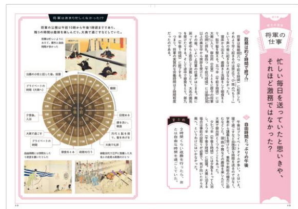
<「武士の生活」ページ例>

【リリースに関するお問合せ】 株式会社 昭文社ホールディングス 広報担当：竹内、張 TEL：03-3556-8124 | FAX：03-3556-8164