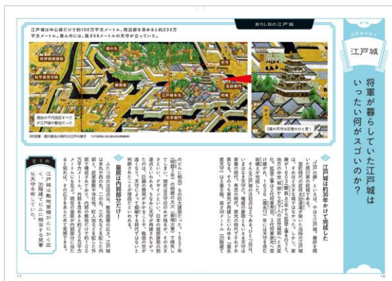
<「江戸のキホン」ページ例>

「江戸のキホン」、「江戸のしくみ」、「武士の生活」、「庶民の生活」、「江戸の商売」、「遊びと娯楽」の6つのテーマの下、幕府の政治機構や将軍の暮らしといったくお上の仕組み>から、商人、農民などの衣食住、仕事、娯楽など<庶民の仕組み>までを、浮世絵や地図を交えて読み解く、江戸時代を理解するのに最適なガイドブックです。