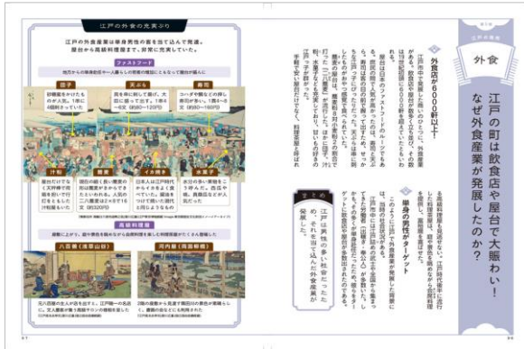
<「江戸の商売」ページ例>

「江戸の町はなぜ外食産業が発展したのか？」「歌舞伎はなぜ人々の心をつかんだのか？」親近感の湧くテーマかつ、疑問形のタイトルに興味をそそられ、ついつい読んでしまう本書の各見開きページは、要約文と図解で半分ずつ使い分け、<スッと頭に入る>ことを意識しながら、江戸時代のリアルを丁寧に伝えています。読み終えた後、数百年前の江戸時代をグッと身近に感じられるよう、工夫を凝らした一冊です。