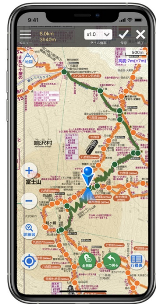
&lt;「山と高原地図ホーダイ」使用イメージ&gt;