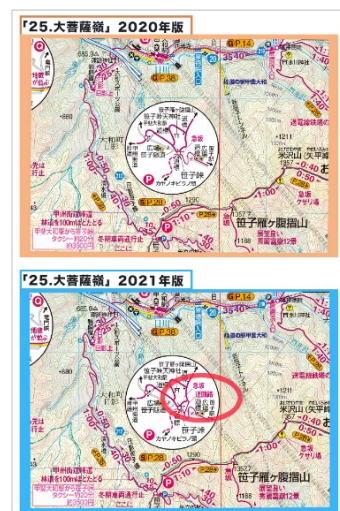
＜「大菩薩峠」2020年と2021年版詳細拡大図例＞

通常 1：50,000 の縮尺を採用している『山と高原地図』ですが、分岐やルートが複雑な場所には部分的な詳細拡大図の導入を進めています。2021年版では、道迷いの危険度の高い箇所にてより精緻な情報を提供することに努めました。