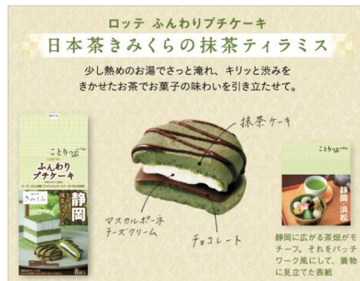
<ことりっぷ ふんわりプチケーキ 日本茶きみくらの抹茶ティラミス>