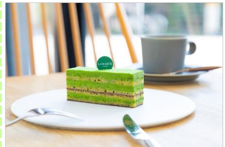
<ラマルクの抹茶のオペラケーキ>

商品名 : ことりっぷ プチチョコパイ <ラマルクの抹茶のオペラケーキ> 発売日 : 2021年2月2日(火) 発売地区 : 全国 内容量 : 8個 価格 : オープン価格 (想定小売価格 250円前後〔税抜〕)