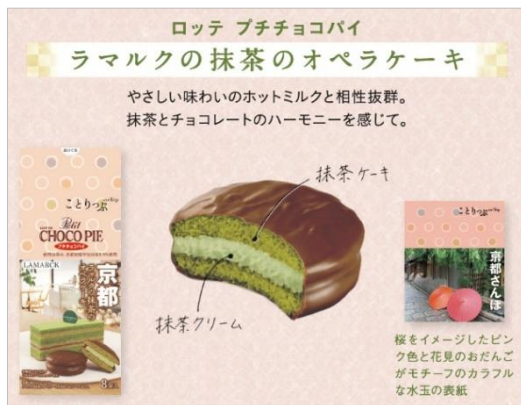
<ことりっぷ プチチョコパイ ラマルクの抹茶のオペラケーキ>

このコラボレーションは、「ことりっぷ」が旅好きな女性に人気があり、旅に誘う気分させること、地で人気のお店をご紹介していることから実現。2020年10月の初コラボが大好評につき、第2弾の発売となりました。味の再現においては、何度も試作を重ね、素材や製法にもこだわっています。商品パッケージにはことりっぷシリーズの「京都さんぽ」と「静岡・浜松」の表紙柄を採用し、「ことりっぷ」の世界観をそのままお届けします。