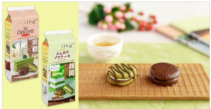
<「ロッテ」×「ことりっぷ」×「旅先の人気店」2商品のイメージ画像>

家にいながら、まるで旅先にいるような気分を味わえる、3社コラボならではの新しい取り組み。第2弾となる今回は、旅先の地で愛される、京都のパティスリー「LAMARCK(ラマルク)」と、静岡に本店を構える日本茶専門店「きみくら」、それぞれの抹茶スイーツの味わいを再現した、ロッテのプチチョコパイとふんわりプチケーキが登場。パッケージは「ことりっぷ」シリーズの表紙をイメージして仕上げました。