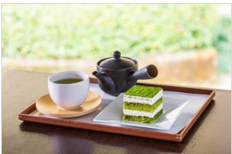
<きみくらの抹茶ティラミス>

商品名 : ことりっぷ ふんわりプチケーキ <きみくらの抹茶ティラミス> 発売日 : 2021年2月2日(火) 発売地区 : 全国 内容量 : 8個 価格 : オープン価格 (想定小売価格 250円前後〔税抜〕)