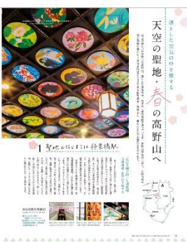
<天空の聖地・春の高野山へ>