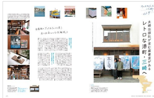
＜すてきな人がいる町に＞

「すてきな人がいる町に」は、ご夫婦で出版社を営み蔵書室もある神奈川県三浦市の「本と屯」を訪ねました。「京都よりみちこみち」では、南北に走る「寺町通」エリアをぶらりとおさんぽ。また「東京さんぽ」はゆったりとした時間が流れる、下町「駒込」エリアの特集です。内容盛りだくさん、読み応え満載のコンテンツを凝縮しました。