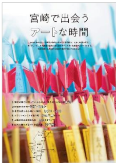
<宮崎で出会うアートな時間>