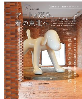
<アートを巡る、春の東北へ>