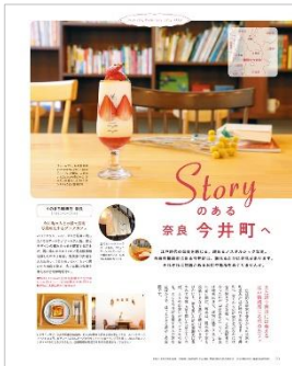
<Storyのある奈良 今井町へ>