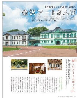
<金沢アートさんぽ>