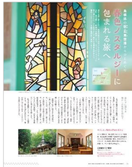
<島根県の萩・石見空港からひとめぐり>