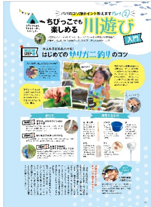
<ちびっこでも 楽しめる川遊び入門>