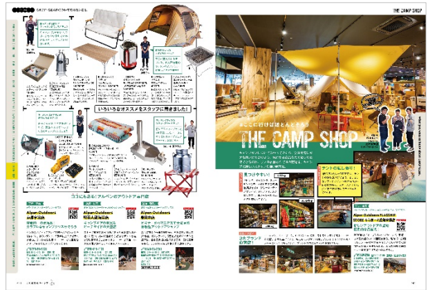
<THE CAMP SHOP>