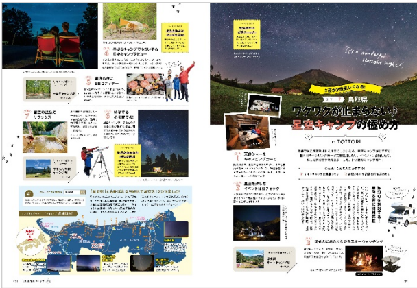
<ワクワクが止まらない♪ 星空キャンプの極め方>