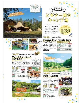
< (MY★BEST キャンプ場) ビギナー向け >