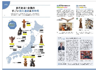
<「全国のすごい縄文遺跡&博物館」紹介ページ>