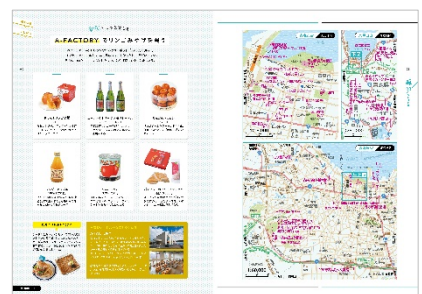
<青森をもっと楽しむ&地図ページ>