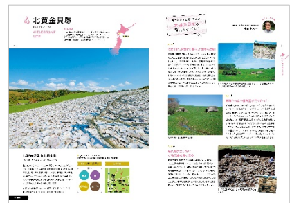
<「北黄金貝塚」紹介ページ>