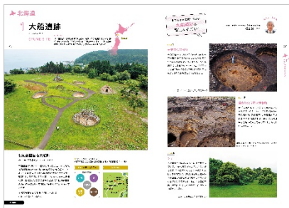
<「大船遺跡」紹介ページ>