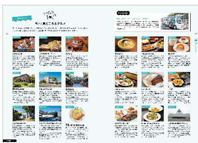
<「青森タウン」紹介ページ>