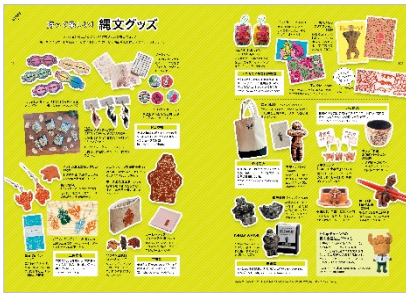
<縄文グッズ紹介ページ>