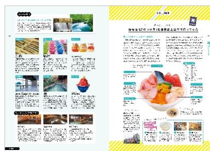
<旅のポイント&コラムページ>