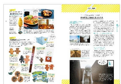
<できること&コラムページ>