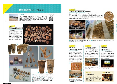
<「縄文時遊館」紹介ページ>