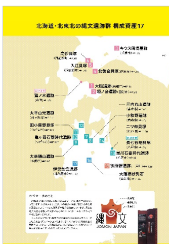
<縄文遺跡群 構成資産 17>

本書のメインコンテンツです。17の遺跡を139ページにわたりご紹介、地元学芸員さんのオススメ、遺跡のすごいポイント、遺跡の出土遺物が展示されている博物館や資料館と、そこでできる体験など情報満載です。また、遺跡周辺の見どころや地域に関わる楽しいコラムも付いています。