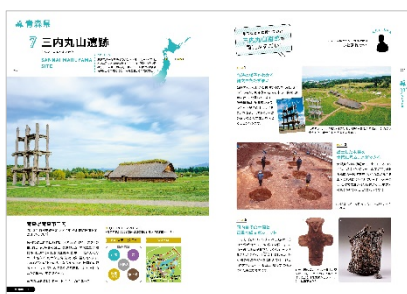
<「三内丸山遺跡」紹介ページ>