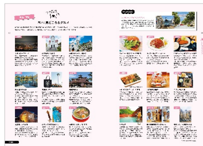
<「函館・鹿部」紹介ページ>