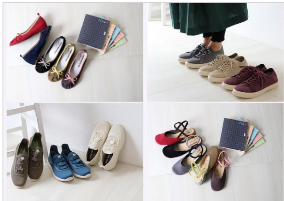
<ことりっぷ×COULEUR VARIE コラボ商品のイメージ画像>

なお、ことりっぷとクロールバリエのコラボ商品企画は2016年9月以来、2回目となります。