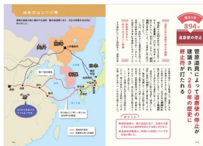
<「遣唐使の停止」誌面例>