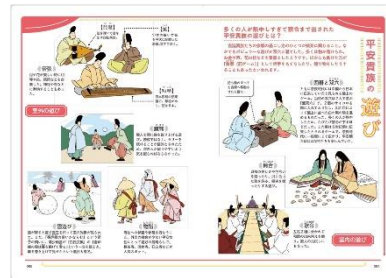
&lt;「平安貴族の遊び」誌面例&gt;