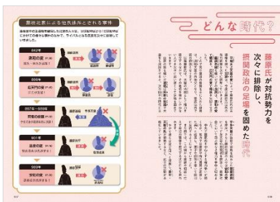
<「どんな時代？」誌面例>

長い平安時代の流れをスツと理解できるよう、本書は時代を動かした藤原氏の盛衰を軸にページを構成してみました。「藤原四家による権力闘争の時代」、「藤原氏による他氏排斥の時代」、「藤原摂関政治の全盛時代」、「藤原氏の衰退」の4期に分け、それぞれの時代背景のページを設けて丁寧に説明した上、遣唐史の停止、源平合戦、平治の乱など、部分的に歴史事象もクローズアップ。シリーズの特徴を最大限に生かし、 地図やイラストをふんだんに使用することによって 、シンプルで理解しやすい視覚的な表現となり、 歴史上の重要情報や難解点が一気に分かりやすくなります 。