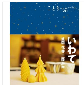
<『ことりっぷいわて』表紙>