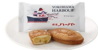
<横浜ハーバー ダブルマロン>

船と港町横浜を愛してやまない柳原良平画伯でお馴染のオリジナルパッケージで、船の形をかたどった人気のマロンケーキ。薄くソフトなカステラ生地に刻んだ栗と栗あんをやさしく包み込み、しっとりとした食感とお口に広がるマロンの味わいが絶妙な味わいです。