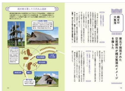
<「縄文の大集落」誌面例>