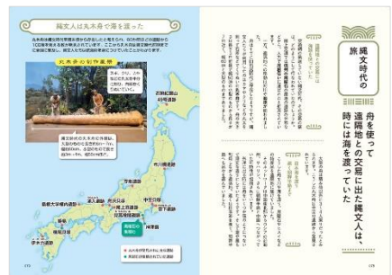
<「縄文時代の旅」誌面例>