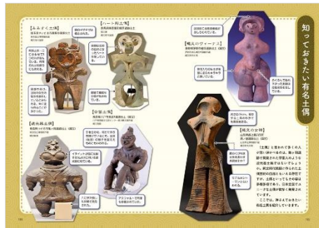
<「知っておきたい有名土偶」誌面例>

シリーズの特徴として、地図やイラスト、写真などの カラービジュアル をふんだんに使用。1つの小テーマを見開きページでまとめ、堅苦しくなりがちな歴史解説本とは一線を画し、イメージが連なるページをパラパラとめくるだけで、 縄文時代の姿がスツと頭に入ってくる ように仕上げました。