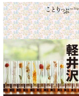
<『ことりっぷ軽井沢』表紙>