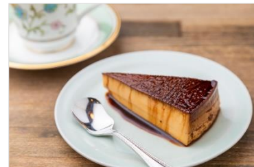
<東出珈琲店のプリン>

金沢・近江町市場にある、こだわりの自家焙煎珈琲が楽しめる喫茶店。東出珈琲店の「プリン」は「ことりっぷ」でも紹介されており、カラメルのほろ苦さとプリンの甘さがベストマッチな商品。濃いカラメルソースが特徴の大人な味わいが楽しめます。