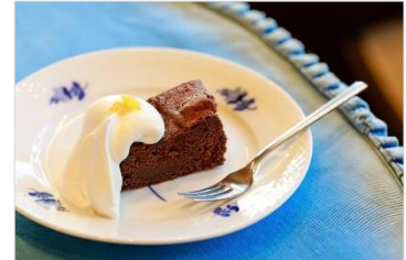
<珈琲歌劇のガトーショコラ>