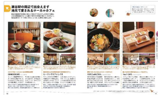
<地元で愛されるローカルカフェ>