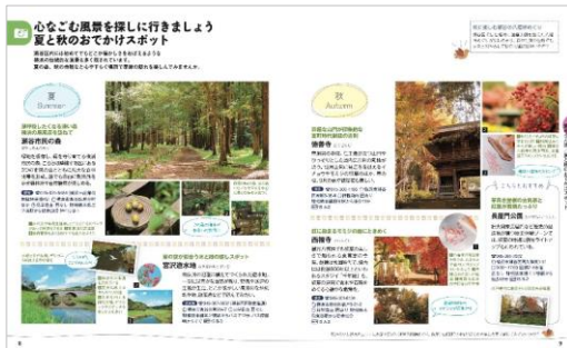
<夏と秋のおでかけスポット>