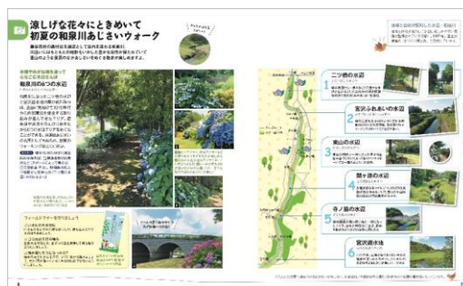
<初夏の和泉川あじさいウォーク>

国際園芸博覧会に向けてのイベント情報、博覧会の紹介記事も掲載、5年後まで使える保存版の冊子ともなっています。