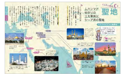
<三大宗教の聖地紹介ページ、左から「仏教」「キリスト教」「イスラム教」>