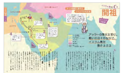
<三大宗教の開祖紹介ページ、左から「仏教」「キリスト教」「イスラム教」>